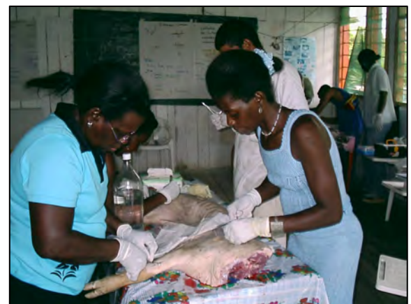
Promotoras suturando la pierna de un cerdo