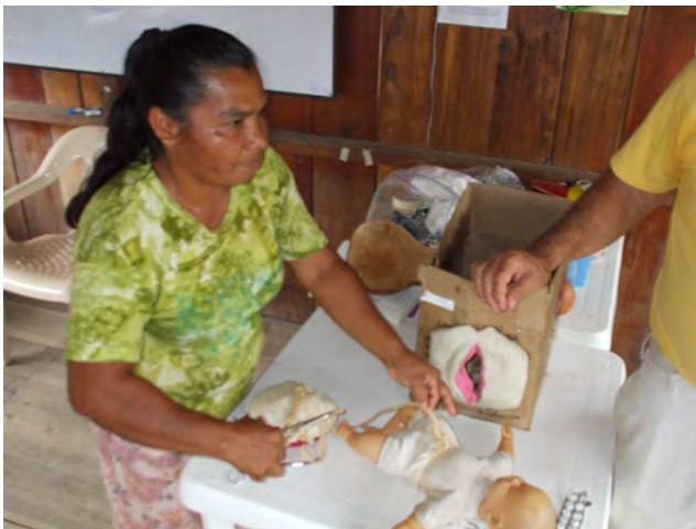
Promotora mostrando su técnica de atender el parto. Más tarde, en plenaria, se comparten las ventajas y los riesgos de cada técnica. En esta foto: la manipulación del cordón, riesgos y peligros.