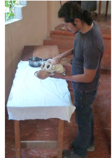
Promotor manipulando el modelo de la pelvis