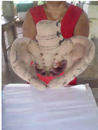
Modelo de pelvis