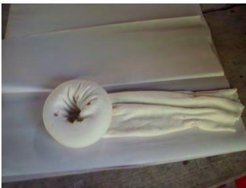
Calcetín cortado para formar un tubo. Enrollarlo para hacer un modelo de cérvix.