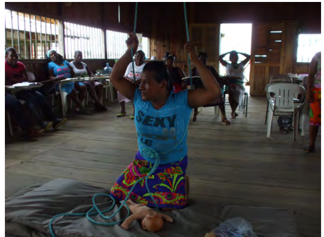
Promotora mostrando la posición de parto más común en su comunidad