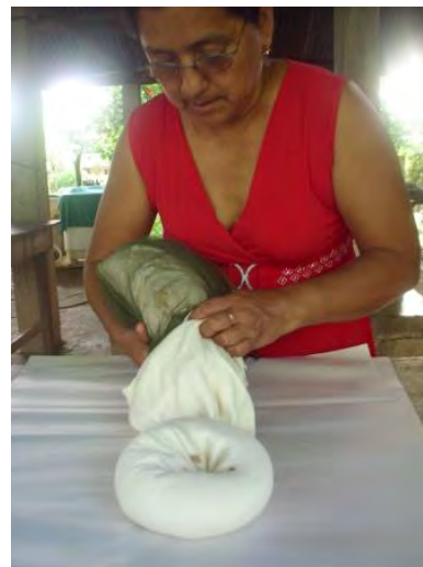
Meter en el calcetín el modelo del feto con sus membranas (pág. 52)